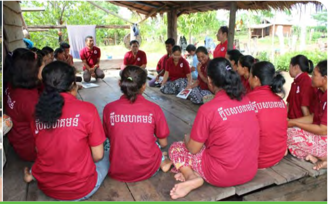
សហគមន៍ចូលរួមជួសជុលអណ្តូងស្នប់ និងក្តីប្រស្តីប្រជុំប្រចាំខែដោយមានការសម្របសម្រួលពីមន្ត្រីគម្រោង