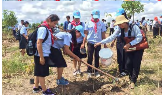
សម្តេចកិត្តិព្រឹទ្ធបណ្ឌិតប្រធាន ផ្តល់ភាពស្និទ្ធស្នាលជាមួយយុវជន កក្រក និង សកម្មភាពយុវជនកំពុងចូលរួមដាំកូនឈើនៅខេត្តកំពត