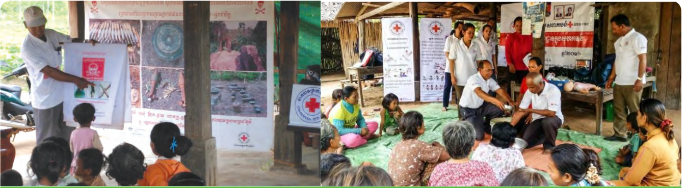
អ្នកស្ម័គ្រចិត្តកំពង់ពន្យល់ពីគ្រោះថ្នាក់នៃគ្រាប់មីន ឬគ្រាប់មីនទាន់ផ្ទះ និងបង្ហាញការអនុវត្តមេរៀនវិជ្ជាសង្គ្រោះបឋម