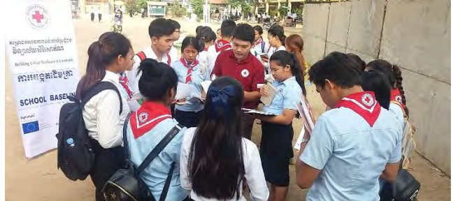
មន្ត្រីគម្រោង និងយុវជន កក្រក កំពុងពិភាក្សាអំពីហានិភ័យក្នុង សាលារៀន នៅក្រុងសេរីសោភ័ណ ខេត្តបន្ទាយមានជ័យ

✓ ផ្តល់សម្ភារៈសង្គ្រោះបឋម ជូនអ្នកស្ម័គ្រ ចិត្តចំនួន ៣៣កញ្ចប់ និងវិទ្យាល័យចំនួន ១២កញ្ចប់។