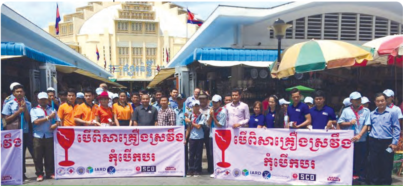
មន្ត្រីគម្រោង ម្ចាស់ជំនួយ យុវជន កក្រក ប៉ូលីសចរាចរណ៍ និងភាគីពាក់ព័ន្ធក្នុងថ្ងៃយុទ្ធនាការអប់រំសុវត្ថិភាពចរាចរណ៍