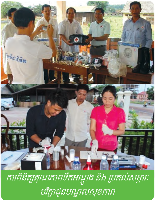
ការពិនិត្យគុណភាពទឹកអណ្តូង និង ប្រគល់សម្ភារៈបរិក្ខារជូនមណ្ឌលសុខភាព