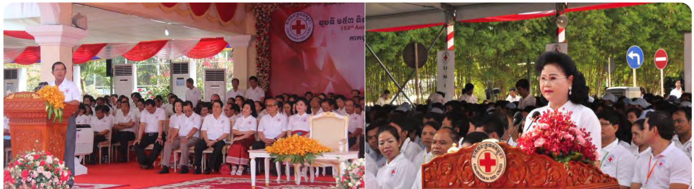
សម្តេចតេជោនាយករដ្ឋមន្ត្រី និងសម្តេចកិត្តិព្រឹទ្ធបណ្ឌិតប្រធាន ថ្លែងសុន្ទរកថានាទិវាពិភពលោកកាកបាទក្រហម អន្តរក្រហម ៨ឧសភា