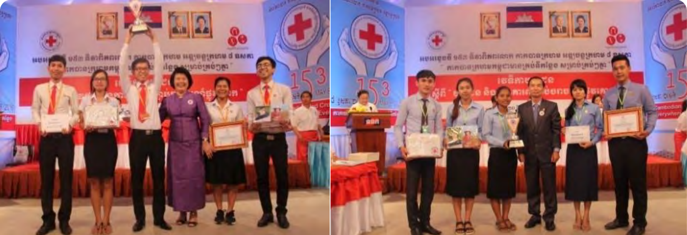
យុវជន កក្រក ចូលរួមឆ្លើយសំណួរក្នុងវេទិកាយុវជនស្តីពី “យុវជន និងការគោរពច្បាប់ចរាចរណ៍ផ្លូវគោក”