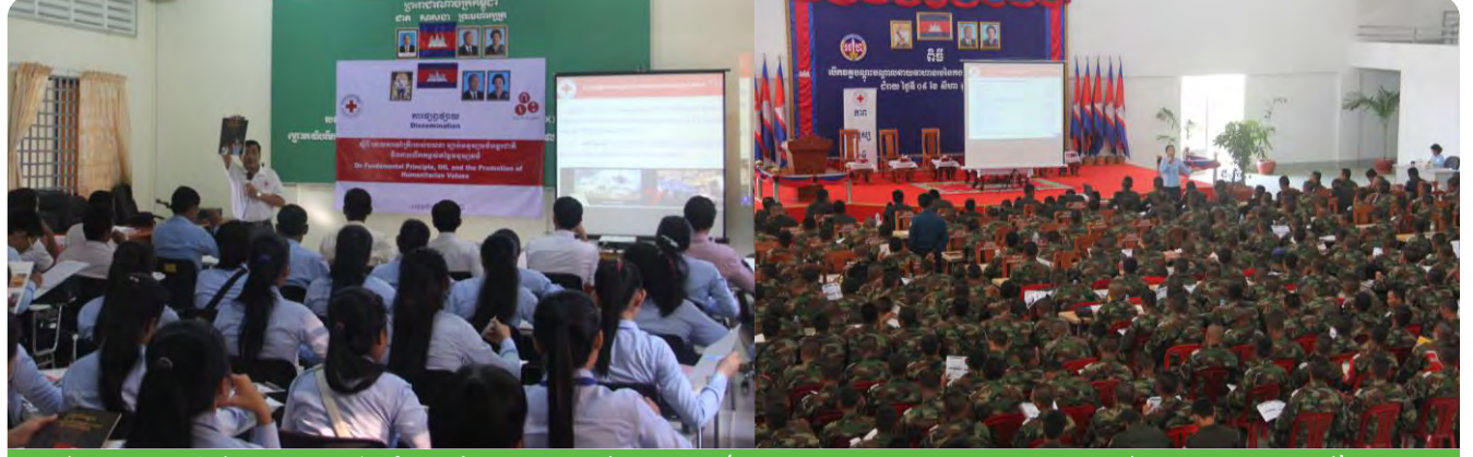
ពិធីផ្សព្វផ្សាយអំពីគោលការណ៍គ្រឹះរបស់ចលនា ច្បាប់មនុស្សធម៌អន្តរជាតិ ជូនសិស្ស-និស្សិត និងមន្ត្រីកងរាជអាវុធរំក្រៅប្រទេស