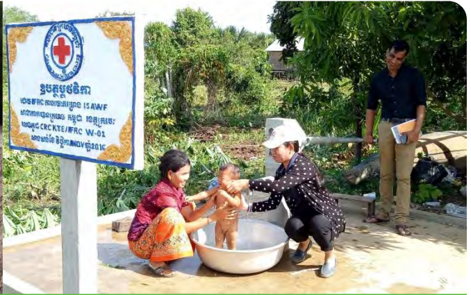
ស្រះទឹកសហគមន៍ដែលបានស្តារឡើង នៅស្រុកចន្ទ្រា ខេត្តស្វាយរៀង និងអណ្តូងទឹកអាហ្វ្រិកដែលនៅចិត្របូរី ខេត្តក្រចេះ