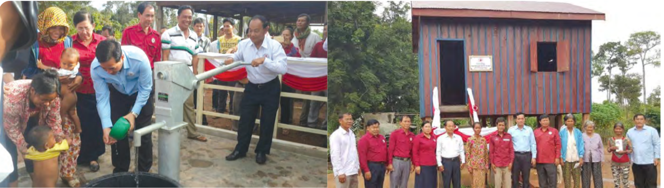
ឯ.ខ នាយក នាយកដ្ឋានគ្រប់គ្រងគ្រោះមហន្តរាយ តំណាងសម្តេចកិត្តិព្រឹទ្ធបណ្ឌិតប្រធាន កក្រក ប្រគល់អណ្តូងស្នប់អាហ្វ្រិដេស៍ ជូនសហគមន៍ និង ផ្ទះ ជូនគ្រួសារក្រីក្រនៅខេត្តព្រះវិហារ