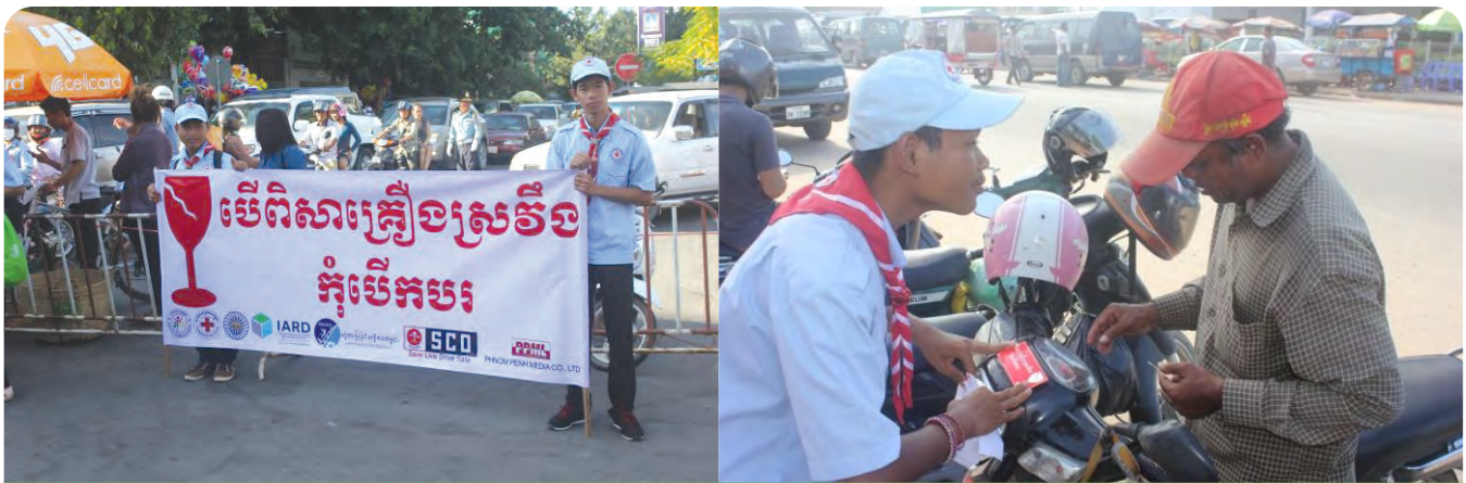
យុវជន កក្រក ចុះផ្សព្វផ្សាយសុវត្ថិភាពចរាចរណ៍នៅតាមទីសាធារណៈ ក្នុងពេលពិធីបុណ្យជាតិ

✓ ផ្តល់វគ្គបណ្តុះបណ្តាលសមត្ថភាព ជូនគ្រូបង្គោលសុវត្ថិភាពចរាចរណ៍ចំនួន១៥នាក់ នៅតាម សាលាកាកបាទក្រហមកម្ពុជាខេត្តសៀមរាប ព្រៃវែង និងព្រះសីហនុ ដើម្បីជួយបណ្តុះបណ្តាលបន្ត ទៅដល់ក្រុមយុវជន អ្នកស្ម័គ្រចិត្ត និងក្រុមគោលដៅពាក់ព័ន្ធផ្សេងទៀត។