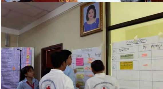
គណៈកម្មាធិការសាខា រួមជាមួយមន្ត្រីប្រតិបត្តិ និងយុវជនកក្រក កំពង់ចូលរួមប្រជុំពិភាក្សាការប៉ាន់ប្រមាណសមត្ថភាពសាខា កក្រក ខេត្តប៉ៃលិន ដោយមានការសម្របសម្រួលពីមន្ត្រីថ្នាក់កណ្តាល