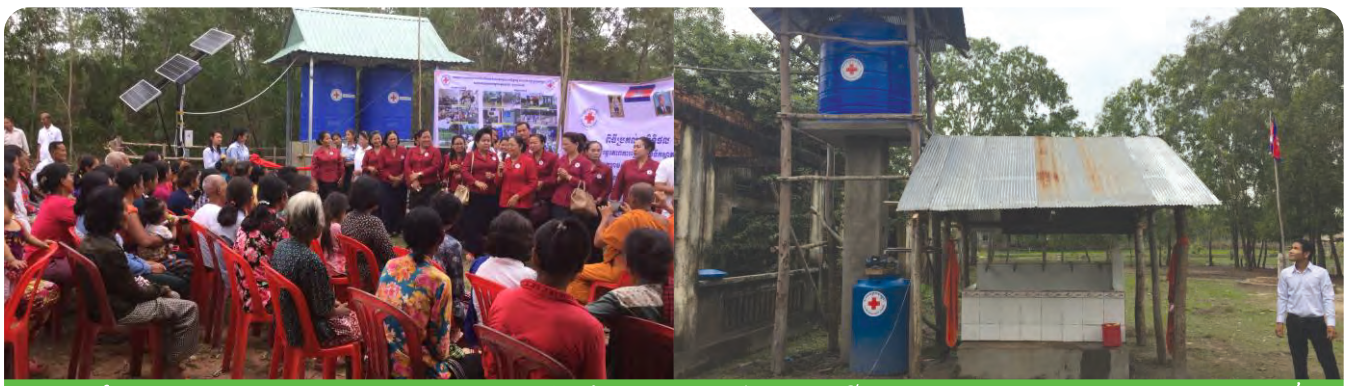
លោកជំទាវអគ្គលេខាធិការរងទី១ កក្រក ក្នុងពិធីប្រគល់ស៊ីរ៉ែទន់ទឹក និងប្រព័ន្ធបូមទឹកដើរដោយថាមពលពន្លឺព្រះអាទិត្យនៅខេត្តស្វាយរៀង