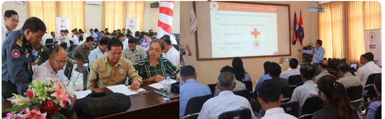
ការធ្វើអង្កេតផ្ទៃក្នុង ស្តីពីការយល់ដឹងក្នុងការប្រើប្រាស់បដិវប ជូនគណៈកម្មាធិការ ក្រុមប្រតិបត្តិសាខា និងទីប្រឹក្សាយុវជន កក្រក