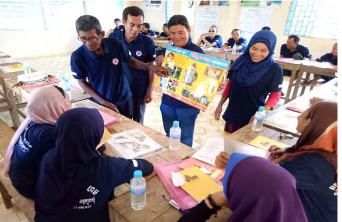
យុវជន និងអ្នកស្ម័គ្រចិត្ត កាក្រក ចូលរួមវគ្គបណ្តុះបណ្តាលស្តីពីបញ្ហាសុខភាពក្នុងសហគមន៍ និងវិជ្ជាសង្គ្រោះបឋម ដើម្បីទៅផ្សព្វផ្សាយបន្ត