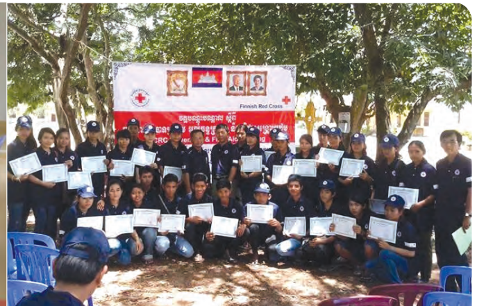
មន្ត្រីផ្តល់វគ្គបណ្តុះបណ្តាលអំពីការប្រែប្រួលអាកាសធាតុជូនអ្នកស្ម័គ្រចិត្ត នៃសាខា កក្រក ខេត្តកំពង់ឆ្នាំង