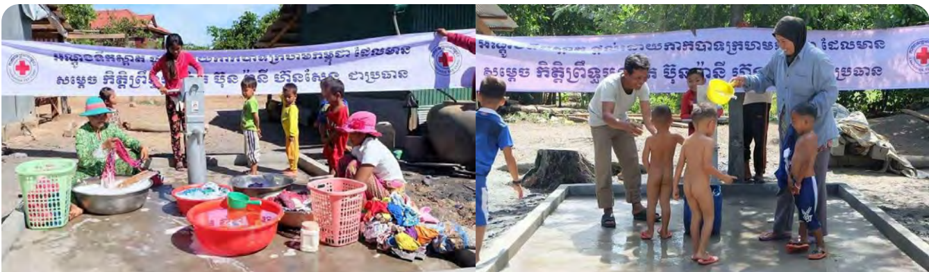
លោកជំទាវអគ្គលេខាធិការ និង អគ្គលេខាធិការរងទី១ កក្រក ប្រគល់អណ្តូងទឹកស្អាត និង ជូន នៅខេត្តបន្ទាយមានជ័យ និងខេត្តកំពត