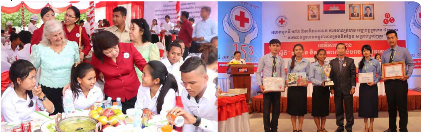
លោកជំទាវអនុប្រធាន កក្រក ចុះសួរសុខទុក្ខ និងរៀបចំអាហារជូន ចាស់ជរា កុមារ និងអ្នកមានជំងឺប្រចាំកាយ នៅមណ្ឌលសង្គ្រោះជនអស់ សង្ឃឹម និងយុវជនចូលរួមឆ្លើយសំណួរក្នុងវេទិកាពិភពលោកប្រយុទ្ធនឹងជំងឺអេដស៍ ១ធ្នូ

២. បានរៀបចំទិវាពិភពលោកប្រយុទ្ធនឹងជំងឺអេដស៍ ១ធ្នូ ឆ្នាំ២០១៦ នៅស្ថានីយ៍ទូរទស្សន៍ជាតិកម្ពុជា ក្រោមប្រធានបទ “យុវជនកម្ពុជាប្តេជ្ញា រួមចំណែកការពារមិនឱ្យឆ្លងអេដស៍” ឆ្លើយតបការងារឥស្សរជនឆ្លើយថ្នាក់ជាតិ នៃវេទិកាភាពជាអ្នកដឹកនាំតំបន់អាស៊ីប៉ាស៊ីហ្វិកឆ្លើយតបមេរោគអេដស៍ និងជំងឺអេដស៍នៅកម្ពុជា ដោយមានការ ចូលរួមពីថ្នាក់ដឹកនាំ មន្ត្រីកាកបាទក្រហមកម្ពុជា សាស្ត្រាចារ្យ និស្សិត យុវជន និងអ្នកស្ម័គ្រចិត្តកាកបាទក្រហម កម្ពុជាចំនួន ១៥០នាក់។