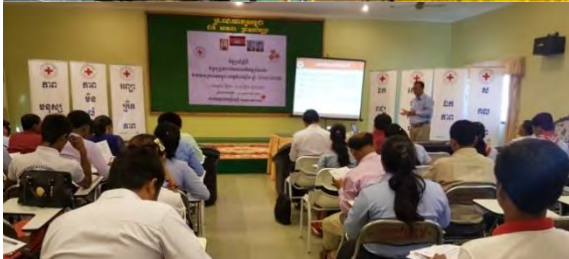
៦.១ អគ្គលេខាធិការរងទី២ ដឹកនាំកិច្ចប្រជុំការប៉ាន់ប្រមាណសមត្ថភាពសាខា កក្រក ខេត្តបាត់ដំបង និងមន្ត្រីផែនការសម្របសម្រួលការធ្វើបច្ចុប្បន្នភាពផែនការអភិវឌ្ឍសាខា កក្រក ខេត្តកំពង់ឆ្នាំង