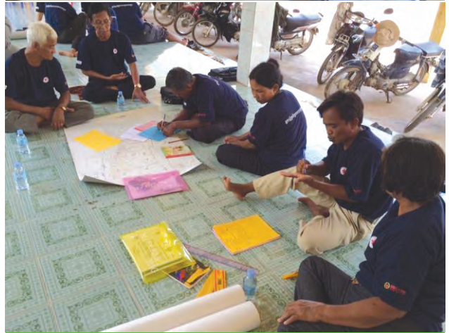
មន្ត្រីគម្រោងកំពុងពន្យល់អំពីអនាម័យ ទឹកស្អាតជូនសហគមន៍ និង អ្នកស្ម័គ្រចិត្តកំពុងគូសផែនទីភាពងាយរងគ្រោះ

✓ ផ្តល់សម្ភារៈមួយចំនួន រួមមាន ម៉ូតូហុងដា សើរីឆ្នាំ២០១៦ចំនួន១គ្រឿង កុំព្យូទ័រ១គ្រឿង ព្រីនធ័រ១គ្រឿង តុការិយាល័យ៣ និងកៅអី៥ សម្រាប់ការប្រើប្រាស់ក្នុងដំណើរការអនុវត្តគម្រោង។