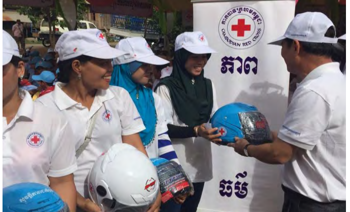
ប្រធានគណៈកម្មាធិការផ្តល់បណ្ណសារសើរ និង ម្នាក់សុវត្ថិភាពជូនអ្នកស្ម័គ្រចិត្ត ក្នុងពិធីទិវាអ្នកស្ម័គ្រចិត្តអន្តរជាតិនៅខេត្តត្បូងឃ្មុំ