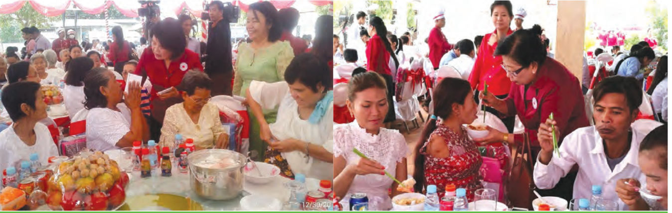
លោកជំទាវអនុប្រធាន កក្រក ចែកអំណោយមនុស្សធម៌ និងរៀបចំអាហារ ជូនជនងាយរងគ្រោះ នៅអង្គការសង្គ្រោះជនអស់សង្ឃឹម