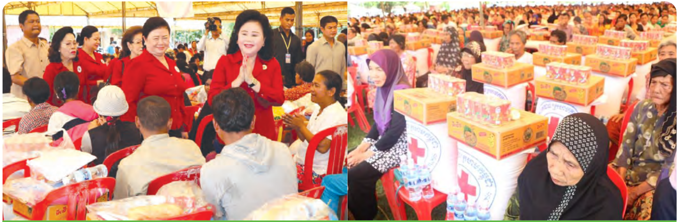
សម្តេចកិត្តិព្រឹទ្ធសធិបតីប្រធាន ពេលចុះថែកអំណោយចំនួន ២,៦៥០គ្រួសារ នៅស្រុកពញាឮក្រក និងស្រុកតំបែរ ខេត្តត្បូងឃ្មុំ

កាកបាទក្រហមកម្ពុជា ក្រោមការដឹកនាំប្រកបដោយគតិបណ្ឌិតខ្ពស់ សម្តេចកិត្តិព្រឹទ្ធសធិបតី ប៊ុន រ៉ានី ហ៊ុនសែន ជាប្រធាន បានជំរុញគ្រប់សកម្មភាពការងារ នៃវិស័យស្នូលទាំង៤ ឱ្យប្រតិបត្តិទៅដោយរលូន និងមានប្រសិទ្ធភាពដោយបានឆ្លើយតបចំពោះភាពងាយរងគ្រោះ និងរងគ្រោះសរុបចំនួន ១៣៣,៦៤២គ្រួសារ ក្នុងនោះពីថ្នាក់កណ្តាលចំនួន ៥៣,៩៩៨គ្រួសារ ពីថ្នាក់សាខាចំនួន ៧៩,៤៦៤គ្រួសារ ច្រើនជាងឆ្នាំ២០១៥ចំនួន ៦៣,៩៣១គ្រួសារ ។ ស្របជាមួយការឆ្លើយតបដ៏មមញ្ជីកនេះ កាកបាទក្រហមកម្ពុជាបានពង្រឹងការរៀបចំព្រឹត្តិការណ៍សំខាន់ៗ ដទៃទៀត ដូចជាទិវាពិភពលោកកាកបាទក្រហម អឌ្ឍចន្ទក្រហម ៨ឧសភា និងអនុវត្តការងារផ្សេងៗ ទៅតាមផែនការ និងកម្មវិធីដែលបានគ្រោងទុក សម្រេចបានលទ្ធផលដូចខាងក្រោម ៖