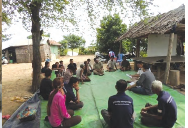
អ្នកស្ម័គ្រចិត្តកំពុងពន្យល់អំពីការកសាងផែនការកាត់បន្ថយហានិភ័យ នៃគ្រោះមហន្តរាយក្នុងសហគមន៍ និង ក្រុមការងារចុះវាយតម្លៃបញ្ចប់ការអនុវត្តគម្រោងនៅខេត្តកំពង់ធំ