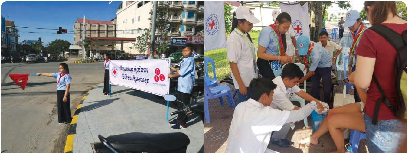
យុវជន កក្រក កំពុងជួយសម្រួលចរាចរណ៍នៅតាមភ្នំងស្តុប និងជួយលាងរបួសទេសចរណ៍បរទេសនៅថ្ងៃបុណ្យសមុទ្រ