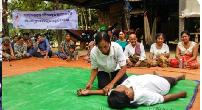
មន្ត្រីគម្រោងនិងអ្នកស្ម័គ្រចិត្ត កំពុងបង្ហាញការអនុវត្តរបៀបសង្គ្រោះបឋមជូនបុគ្គលិកក្រុមហ៊ុន និងសហគមន៍នៅខេត្តកំពង់ធំ