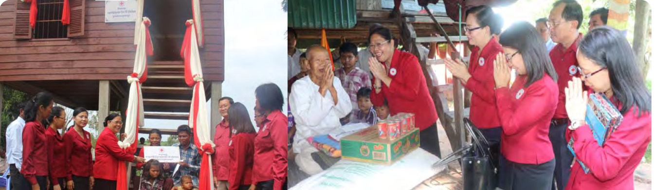
លោកជំទាវអគ្គលេខាធិការរងទី១ ប្រគល់ផ្ទះជូនគ្រួសារពិការនៅខេត្តកំពង់ឆ្នាំង និងគ្រឿងឧបភោគ បរិភោគមួយចំនួន ជូនលោកយាយអាយុ៩១ឆ្នាំនៅខេត្តកំពត