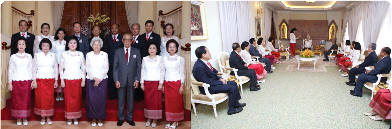
សម្តេចកិត្តិព្រឹទ្ធបណ្ឌិតប្រធាន ដឹកនាំសមាជិកគណៈកម្មាធិការកណ្តាល និងក្រុមប្រតិបត្តិ ចូលបង្គំគាល់ព្រះប្រធានកិត្តិយស កក្រក និងថ្វាយបាយការណ៍វឌ្ឍនភាពរបស់ កក្រក ៦ខែ ដើមឆ្នាំ២០១៦