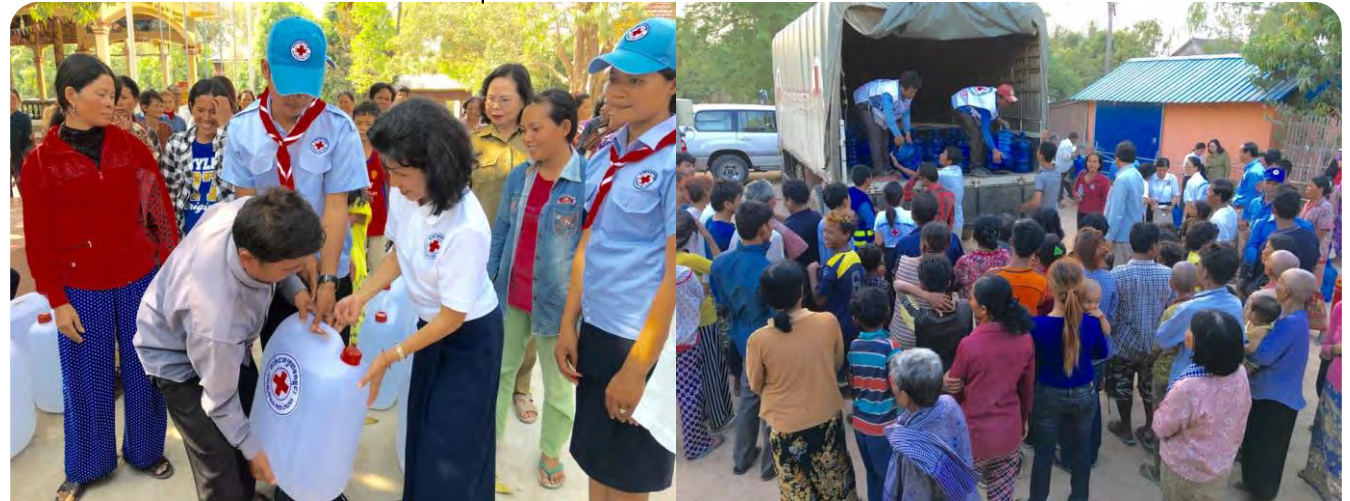
លោកជំទាវអគ្គលេខាធិការ កក្រក និងឯ.ខ. ប្រធានគណៈកម្មាធិការ ព្រមទាំងនាយិកាសាខា កំពុងចាត់ចែងចែកទឹកនៅខេត្តកំពង់ស្ពឺ