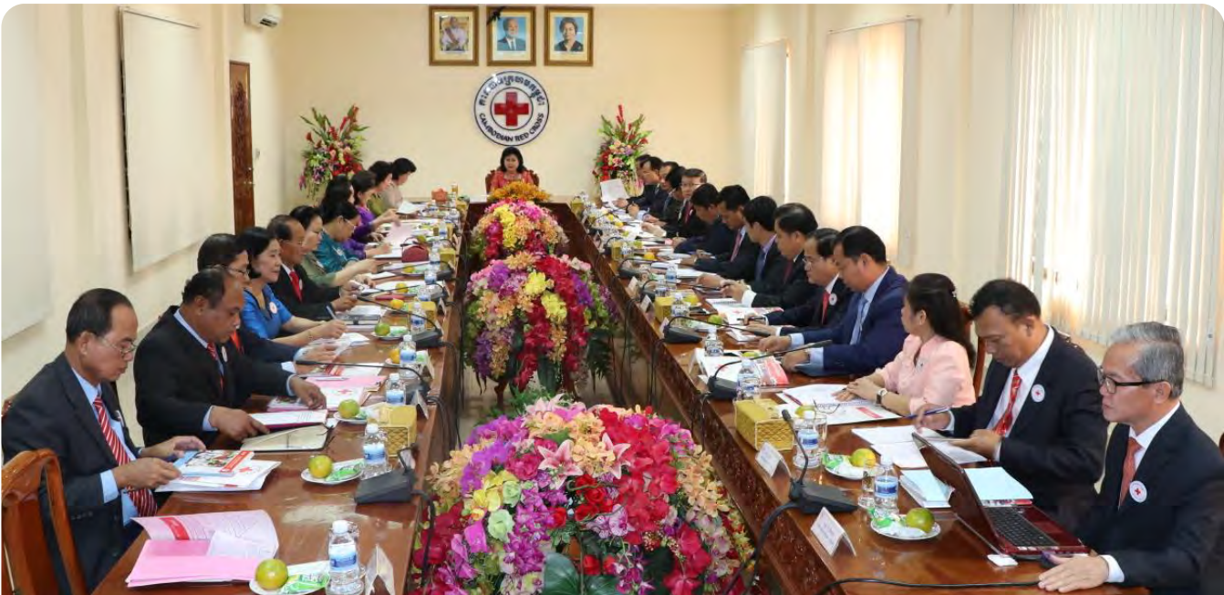
សម្តេចកិត្តិព្រឹទ្ធបណ្ឌិត ប្រធាន ដឹកនាំកិច្ចប្រជុំប្រចាំឆ្នាំ សមាជិក សមាជិកា គណៈកម្មាធិការកណ្តាល និងក្រុមប្រតិបត្តិ កាក្រក

ជាងនេះទៀត សម្តេចកិត្តិព្រឹទ្ធបណ្ឌិតប្រធាន បានដឹកនាំគណៈកម្មាធិការកណ្តាលចូលគាល់ព្រះប្រធាន កិត្តិយស សម្តេចព្រះមហាក្សត្រីព្រះវររាជមាតាជាតិខ្មែរ ទូលថ្វាយនូវរបាយការណ៍ទៀងទាត់ អំពីវឌ្ឍនភាពរបស់ កាកបាទក្រហមកម្ពុជា។ ទន្ទឹមនឹងនេះ ក៏បានថ្វាយកញ្ចប់របាយការណ៍ និងឯកសារថ្វាយ ព្រះករុណាព្រះមហាក្សត្រ សម្តេចព្រះបរមនាថ នរោត្តម សីហមុនី ផងដែរ។