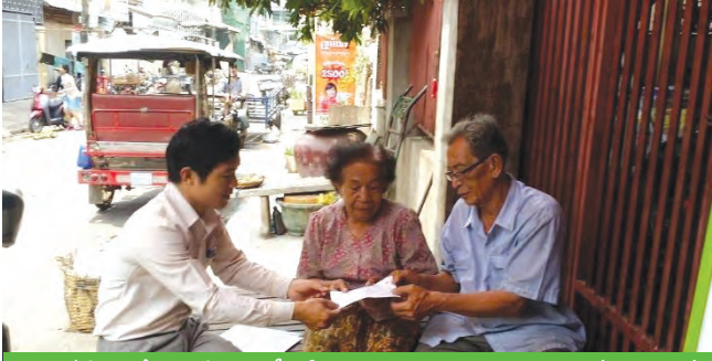
មន្ត្រីកំពុងចែកសំបុត្រដំណឹងគ្រួសារ និងបងប្អូន ដល់អ្នកជាប់ ពន្ធនាគារ និងអ្នកស្វែងរកសមាជិកគ្រួសារដែលបាត់ដំណឹង