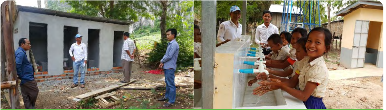
មន្ត្រីពិនិត្យការសាងសង់បង្គន់អនាម័យតាមសាលានៅខេត្តបាត់ដំបង និងសិស្សកំពុងអនុវត្តការលាងដៃ នៅសាលាក្នុងខេត្តកោះកុង