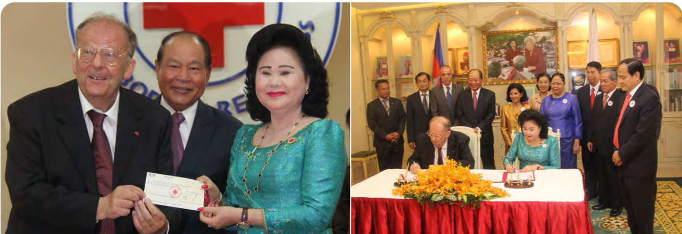
សម្តេចកិត្តិព្រឹទ្ធបណ្ណិក ប្រធាន កក្រក ប្រគល់មូលប្បទានប័ត្រ ១លានដុល្លារ ជូនប្រធានមន្ទីរពេទ្យគន្ធបុប្ផា ដើម្បីចូលរួមសម្រាលការ លំបាករបស់មន្ទីរពេទ្យ ក្នុងការលើកកម្ពស់សុខភាពកុមារនៅកម្ពុជា