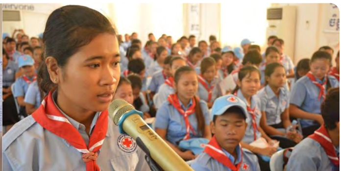
យុវជន កក្រក កំពុងទទួលការបណ្តុះបណ្តាលស្តីពី កម្មវិធីយុវជនកាកបាទក្រហមកម្ពុជា