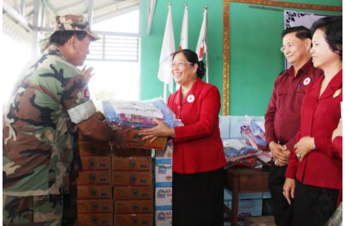
លោកជំទាវអគ្គលេខាធិការរងទី១ ចុះសួរសុខទុក្ខ និងនាំយក អំណោយមនុស្សធម៌ ជូនគ្រួសារយោធិនពិការ

• ចុះសួរសុខទុក្ខ និងផ្តល់អំណោយ ជូន ក្រុមគ្រួសារមន្ត្រីកាកបាទក្រហមកម្ពុជា ថ្នាក់ដឹកនាំមន្ត្រីរាជការ កងកម្លាំងប្រដាប់ អាវុធ សិល្បករ និងប្រជាពលរដ្ឋ ទទួល មរណភាព ដោយឆាតាពាធ និងគ្រោះថ្នាក់ ផ្សេងៗ និងអ្នកមានជីវភាពក្រីក្រ ដែល កំពុងសម្រាកព្យាបាលនៅតាមមន្ទីរពេទ្យ នានាចំនួន ៧០នាក់ ។