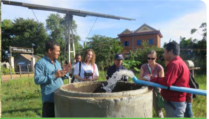
សកម្មភាពខ្លះៗអណ្តូងទឹកស្អាតនៅខេត្តកំពង់ឆ្នាំង និងម្ចាស់អំណោយចុះពិនិត្យប្រព័ន្ធបូមទឹកសូឡានៅខេត្តកំពង់ធំ

• គម្រោងសមាហរណកម្ម ការគ្រប់គ្រងគ្រោះមហន្តរាយ សុខភាព និងការអភិវឌ្ឍន៍ស្ថាប័ន ខុបត្តម្ភដោយ កាកបាទក្រហមចិន បាននិងកំពុងអនុវត្តនៅខេត្តកំពង់ស្ពឺ ក្នុងស្រុកខត្តង្គ ឃុំចំនួន២ ភូមិចំនួន៥ អនុវត្តដោយអ្នកស្ម័គ្រចិត្តចំនួន ២០នាក់ និងមានអ្នកទទួលបានផលសរុបចំនួន ៧៩៦គ្រួសារ។ លទ្ធផលសម្រេចបាន រួមមាន ៖