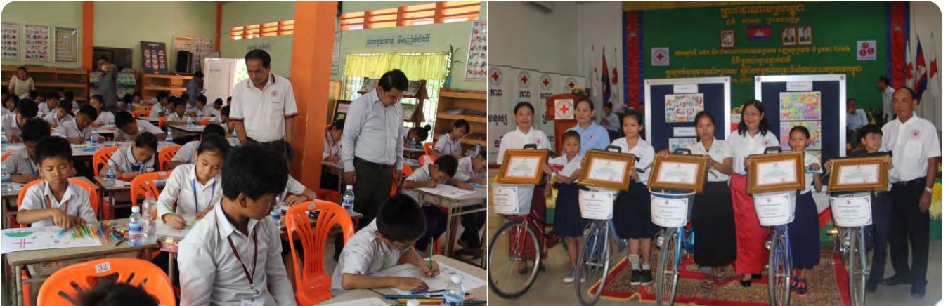
ការប្រឡងគំនូរកុមារអំពីសកម្មភាពចម្រុះវិស័យរបស់ កក្រក និងការផ្តល់រង្វាន់ជ័យលាភីដល់សិស្សានុសិស្ស ដែលជាប់ចំណាត់ថ្នាក់