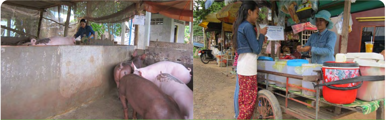
ប្រជាពលរដ្ឋនៅស្រុកលើកដែកកំពុងមានជីវភាពប្រសើរឡើង ពីអាជីវកម្មរបស់គ្រួសារ តាមរយៈគម្រោងប្រាក់កម្ចី