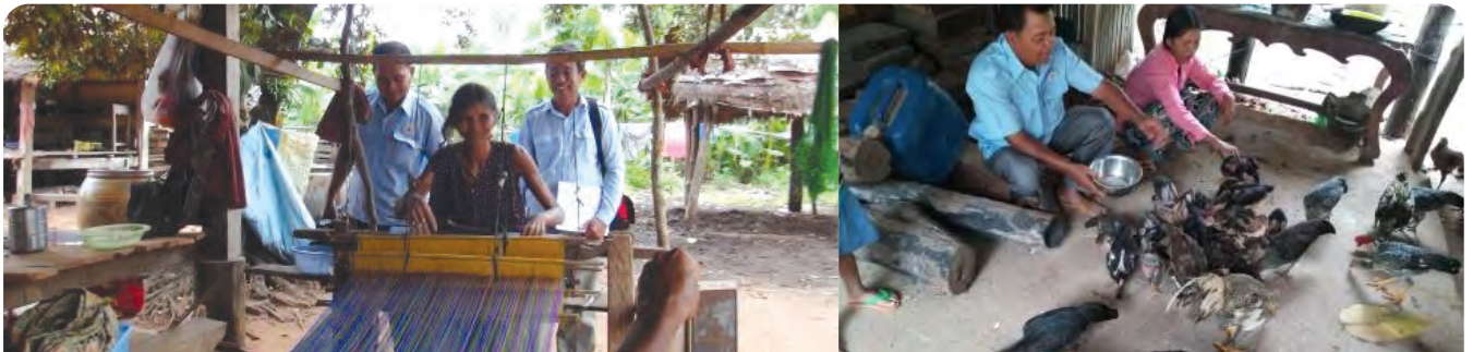
ប្រជាពលរដ្ឋក្នុងស្រុកគោលដៅ កំពុងទទួលផល ពីមុខរបរតម្បាញ ចញ្ជីមសត្វ និងដំណាំអនុផល