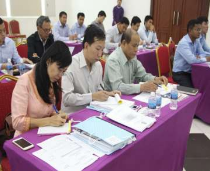
ទន្លេបាសាក់២, ថ្ងៃទី២៧-២៨ ខែកក្កដា ឆ្នាំ២០១៧

ដើម្បីលើកកម្ពស់គុណភាពនិងប្រសិទ្ធភាព នៃការតាមដានត្រួតពិនិត្យ និងវាយតម្លៃការអនុវត្ត កម្មវិធីជាតិកំណែទម្រង់រដ្ឋបាលសាធារណៈ លេខាធិការដ្ឋានគ.ក.រ និងអគ្គនាយកដ្ឋានគោលនយោបាយ មុខងារសាធារណៈ ក្រសួងមុខងារសាធារណៈ បានរៀបចំវគ្គបណ្តុះបណ្តាលស្តីពីប្រព័ន្ធតាម ដានត្រួតពិនិត្យ និងវាយតម្លៃការអនុវត្តកម្មវិធី ជាតិកំណែទម្រង់រដ្ឋបាលសាធារណៈ២០១៥- ២០១៨ ក្នុងគោលបំណងផ្តល់នូវពុទ្ធិដល់មន្ត្រី បង្គោលនៃក្រុមការងារកែទម្រង់រដ្ឋបាលសា ធារណៈនៅថ្នាក់ជាតិ និងនៅថ្នាក់ក្រោមជាតិ ដើម្បីបានយល់ដឹងអំពី៖ (១)ទស្សនទាននៃ ការអនុវត្តនូវប្រព័ន្ធតាមដានត្រួតពិនិត្យ និង វាយតម្លៃ (២)ការតាមដានត្រួតពិនិត្យ និងវាយ តម្លៃដោយផ្អែកទៅលើសូចនាករគោលសមិទ្ធិ កម្មវិធីទៅនឹងវឌ្ឍនភាពការងារ (៣)ដំណើរ