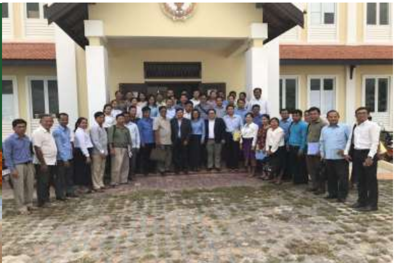
ខេត្តសៀមរាប, ថ្ងៃទី៣០ ខែវិច្ឆិកា ឆ្នាំ២០១៧