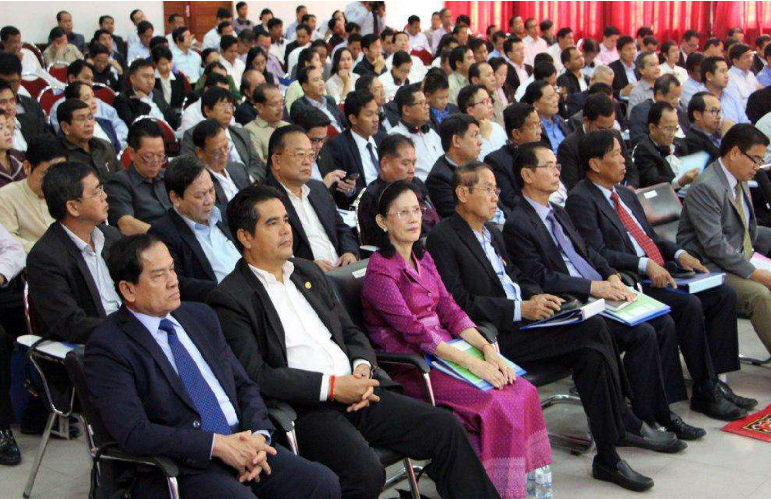
ថ្ងៃទី២៦ ខែតុលា ឆ្នាំ២០១៧ សន្និសីទភាពជាអ្នកដឹកនាំស្តីពីការដឹកនាំយុទ្ធសាស្ត្រការអភិវឌ្ឍមូលធនមនុស្ស និងការប្រមើលមើលទៅថ្ងៃអនាគត

ចង្កោមសកម្មភាព២.១៖ រៀបចំ និងដាក់ឱ្យអនុវត្តក្របខណ្ឌគតិយុត្តនៃការបណ្តុះបណ្តាលជាភាគកិច្ចសម្រាប់មន្ត្រីរាជការស៊ីវិល និងកែលម្អកម្មវិធីបណ្តុះបណ្តាល និងការអភិវឌ្ឍធនធានមនុស្សនៅតាមក្រសួង ស្ថាប័ន ថ្នាក់ជាតិ និងថ្នាក់ក្រោមជាតិ