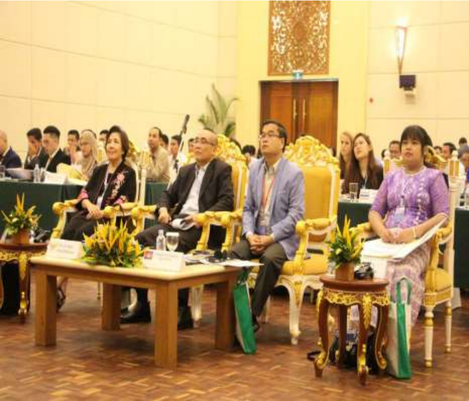
ប្រភព៖ សណ្ឋាគារសុខាសៀមរាប, ថ្ងៃទី០៤-០៦ ខែកញ្ញា ឆ្នាំ២០១៧

(១)ដើម្បីឆ្លើយតបទៅសេចក្តីថ្លែងការណ៍អាស៊ានស្តីពីតួនាទីរបស់មុខងារសាធារណៈដែល ជាកត្តាលិក្ខណៈដើម្បី ឈានទៅសម្រេចបាននូវទស្សនវិស័យសហគមន៍អាស៊ាន២០២៥ (២)អនុវត្តនូវក្របខណ្ឌផែនការសកម្មភាព របស់កិច្ចសហប្រតិបត្តិការអាស៊ានស្តីពីកិច្ចការមុខងារសាធារណៈ ២០១៦-២០២០ មានគោលដៅលើក កម្ពស់សមត្ថភាពមន្ត្រីមុខងារសាធារណៈអាស៊ាន ដើម្បីឆ្លើយតបទៅបញ្ហាប្រឈម និងតម្រូវការរបស់ប្រជាជន តាមរយៈកិច្ចសហប្រតិបត្តិការនិងនវានុវត្តន៍ (៣)ប្រមូលធាតុចូលពីអ្នកជំនាញពាក់ព័ន្ធទាំងអស់គ្រប់កម្រិត រួមមាន៖ អ្នករៀបចំគោលនយោបាយ អ្នកបច្ចេកទេស អ្នកគ្រប់គ្រងក្នុងការ អនុវត្តការងារពីបណ្តាប្រទេសអាស៊ាន ទាំងអស់ (៤)អញ្ជើញវាគ្មិននិងអ្នកជំនាញ កម្រិតខ្ពស់តំណាងប្រទេសអាស៊ានទាំង ១០ រួមទាំងសាធារណៈរដ្ឋកូរ៉េខាងត្បូង និងអង្គការអន្តរជាតិមួយចំនួន រួមជាមួយ នឹងមន្ត្រីរាជការដែលកាន់មុខតំណែង គ្រប់គ្រងបច្ចេកទេសនិងធ្លាប់មានបទ ពិសោធន៍អនុវត្តផ្ទាល់លើការគ្រប់គ្រង គុណភាពនៅតាមក្រសួងស្ថាប័នសំខាន់ៗ នៅថ្នាក់ជាតិ និងថ្នាក់ក្រោមជាតិដើម្បី ចែករំលែកចំណេះដឹងនិងបទពិសោធន៍ លើការអនុវត្តប្រព័ន្ធគ្រប់គ្រងគុណភាព (៥)ផ្តល់មតិយោបល់ និងកែលម្អឯកសារ ណែនាំស្តីពីប្រព័ន្ធគ្រប់គ្រងគុណភាព សម្រាប់វិស័យរដ្ឋបាលសាធារណៈ ឱ្យ