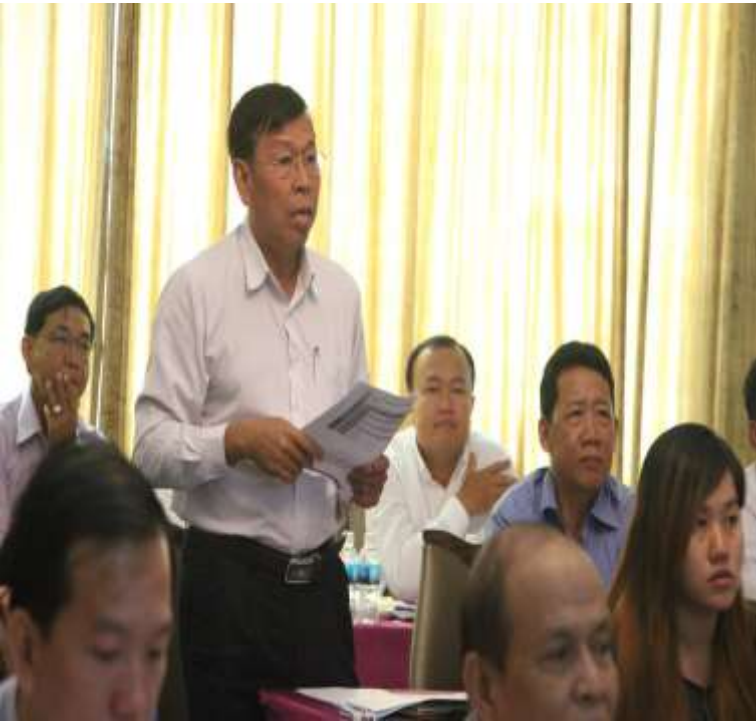
ទន្លេបាសាក់២, ថ្ងៃទី២៧-២៨ ខែកក្កដា ឆ្នាំ២០១៧

ការក្នុងការរៀបចំប្រមូលនិងវិភាគទិន្នន័យ ព្រមទាំងការបញ្ជូលទិន្នន័យទៅក្នុងរបាយការណ៍ទៅតាមទម្រង់របាយការណ៍នីមួយៗដែលបានកំណត់ក្នុងឯកសារគោលការណ៍ណែនាំ (៤)ក្របខណ្ឌលទ្ធផលដែលជាឧបករណ៍សម្រាប់តាមដានត្រួតពិនិត្យវឌ្ឍនភាពការអនុវត្តការងារ ដោយក្នុងនោះរួមមាន៖ ការកំណត់សូចនាករផ្ទៀងផ្ទាត់ ប្រភេទនៃសូចនាករកំណត់និយមន័យសូចនាករ និងអ្នកទទួលខុសត្រូវជាដើម (៥)ការរៀបចំដាក់ចេញរបាយការណ៍វឌ្ឍនភាពការងារជាប្រចាំត្រីមាស ឆមាស និងឆ្នាំ ដើម្បីរាយការណ៍ជូនរាជរដ្ឋាភិបាល (៦)សំដៅចូលរួមការជំរុញការតាមដានត្រួតពិនិត្យ និងវាយតម្លៃការអនុវត្តកម្មវិធីជាតិកែទម្រង់រដ្ឋបាលសាធារណៈក្នុងដែនសមត្ថកិច្ចរបស់ខ្លួនឱ្យកាន់តែប្រសើរ (៧)ចូលរួមសម្របសម្រួល និងផ្តល់នូវរបាយការណ៍សមិទ្ធិកម្មផ្សេងទៅនឹងសូចនាករគោលសមិទ្ធិកម្មទាំង៩ដែលបានកំណត់ក្នុងកម្មវិធីជាតិកំណែទម្រង់រដ្ឋបាលសាធារណៈ ។