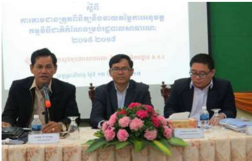
ខេត្តព្រះសីហនុ, ថ្ងៃទី១២ ខែធ្នូ ឆ្នាំ២០១៧

ការបណ្តុះបណ្តាលនេះ បានបណ្តុះបណ្តុះដល់ក្រុមការងារកែទម្រង់រដ្ឋបាលសាធារណៈមកពី ២៩ក្រសួងស្ថាប័នថ្នាក់ជាតិ ក្នុងនោះសមាសភាពចូលរួម សរុបចំនួន ១០០នាក់ ។ ដោយឡែក ក្រុមការងារកែទម្រង់រដ្ឋបាលសាធារណៈនៅតាមរាជធានី ខេត្ត មានចំនួន១២ខេត្ត ដូចជា៖ខេត្តស្វាយរៀង ព្រៃវែង ពោធិ៍សាត់ កំពង់ឆ្នាំង ត្បូងឃ្មុំ កំពង់ចាម សៀមរាប កំពង់ធំ កំពត ព្រះសីហនុ បាត់ដំបង បន្ទាយមានជ័យ ក្នុងនោះមានសមាសភាពចូលរួម រួមមាន៖ អភិបាល-អភិបាលរងខេត្ត នាយក-នាយករងរដ្ឋបាលសាលាខេត្ត នាយក-នាយករងទីចាត់ធនធានមនុស្ស ប្រធាន-អនុប្រធានមន្ទីរជំនាញ អភិបាល-អភិបាលរង ក្រុង ស្រុក នាយក-នាយករងរដ្ឋបាល ក្រុង ស្រុក និងមន្ត្រីជំនាញ សរុបចំនួន ៦០០ នាក់ ។